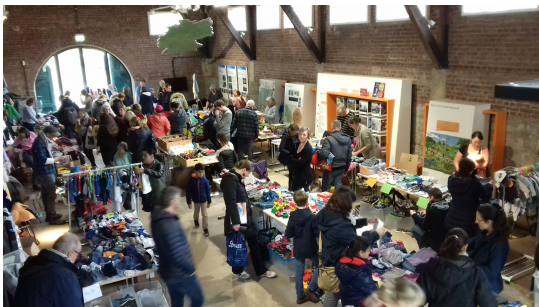
Indoor-Kinderflohmarkt auf Gut Leidenhausen

03.10.2019 | Es wird wieder Zeit, auszumisten! Nach dem großen Erfolg im März wird das Gut Leidenhausen wieder zum Treffpunkt für Verkäufer und Schnäppchenjäger.