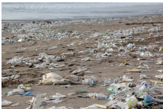
Wanderausstellung 30.09 - 16.10.2019 „Planet Plastic – Erdöl. Macht. Müll.“